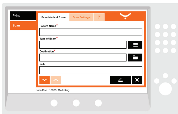
Abbildung 2. Beispiel für einfaches Scanmenü

Zustellung im Auftrag des Benutzers, der das Dokument gescannt hat