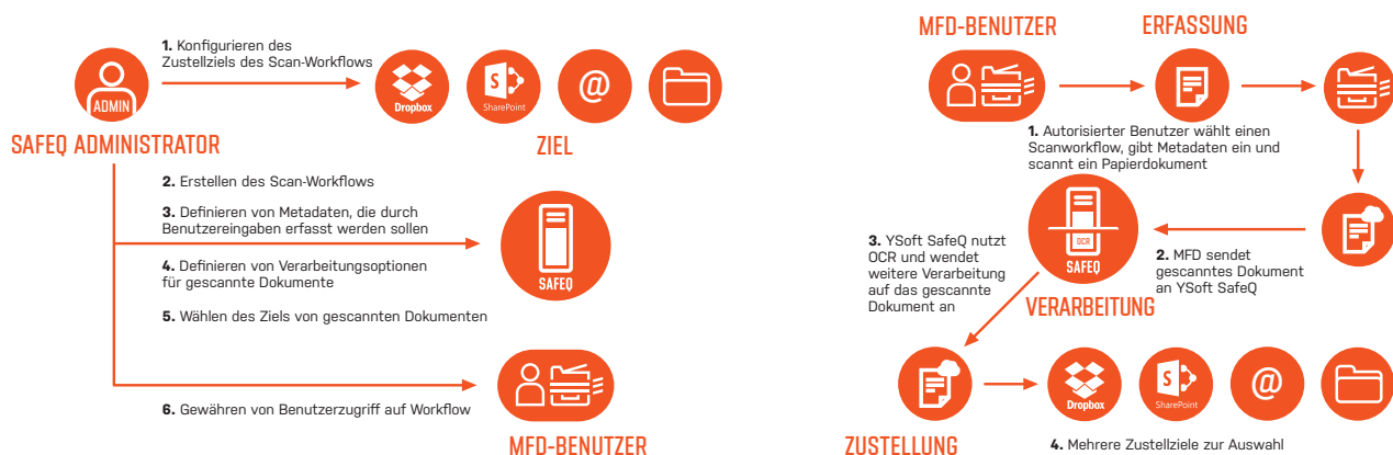
Abbildung 1. Managed Workflows für Administrator und Benutzer.

Kein anderer Anbieter kann mit der technischen Raffinesse, Präzision und Sicherheit sowie der einfachen Bedienung von YSoft SafeQ Workflow Suite mithalten.